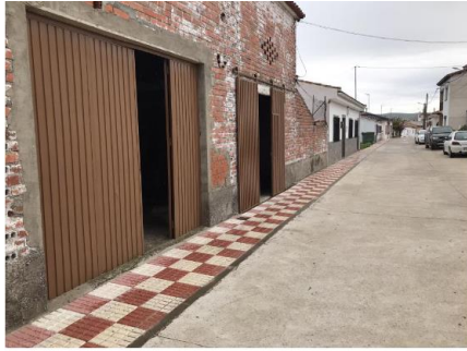
VISTA GENERAL EXTERIOR C/ HERNÁN CORTÉS, 28

Plaza de España, 5 C.P. 10671 Tf. 927 40 20 72 administracion@aldehueladeljerte.es