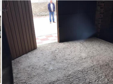
VISTA GENERAL INTERIOR C/ HERNÁN CORTÉS, 28

Según las indicaciones del propietario, durante la reforma de la C/ Hernán Cortés, se dejó dispuesta una acometida a la red general de saneamiento, con la existencia de una arqueta para la conexión en el interior de la edificación.