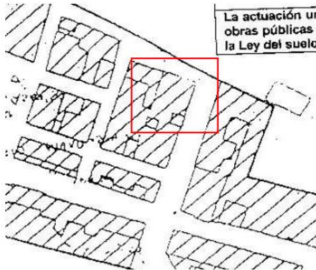
PDSU de Aldehuela del Jerte: ALINEACIONES

Plaza de España, 5 C.P. 10671 Tf. 927 40 20 72 administracion@aldehyueladeljerte.es