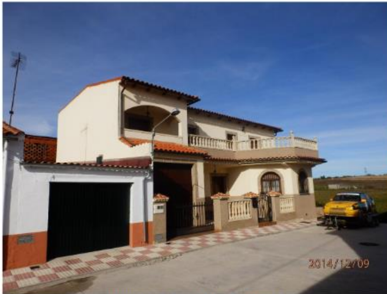
VISTA GENERAL DE LA VIVIENDA

Art. 21.- No se permitirán patios abiertos a fachadas y en caso de proyectarse, estarán cerrados por un elemento de fábrica macizo hasta una altura que no permita ver las fachadas interiores.