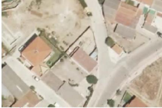
VISTA AÉREA 2016

En la vista aérea actual puede observarse la construcción objeto de este informe.