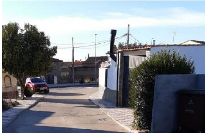
VISTA ACTUAL DE LA ACTUACIÓN

Plaza de España, 5 C.P. 10671 Tf. 927 40 20 72 administracion@aldehueladeljerte.es