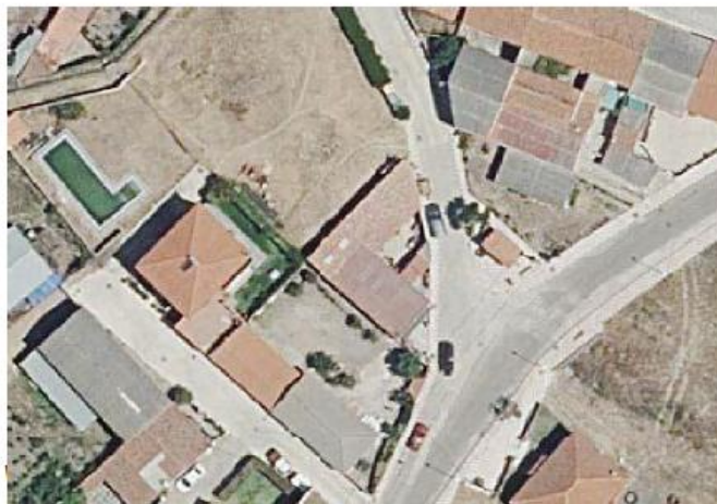
VISTA AÉREA ACTUAL