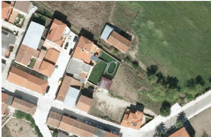
ORTOFOTO ALDEHUELA DEL JERTE 2013

Según la documentación consultada, la piscina data, al menos, del año 2013: