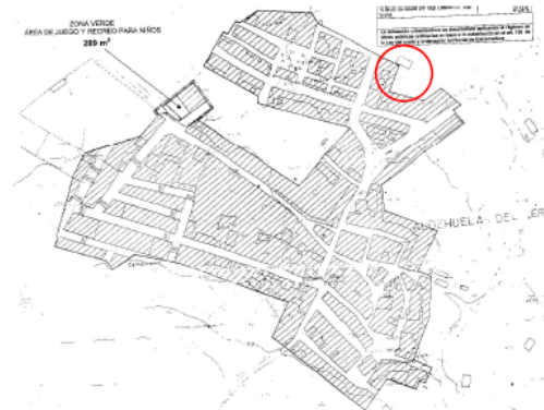
UBICACIÓN SEGÚN POSU DE ALDEHUELA DEL JERTE

Plaza de España, 5 C.P. 10671 Tf. 927 40 20 72 administracion@aldehueladeljerte.es